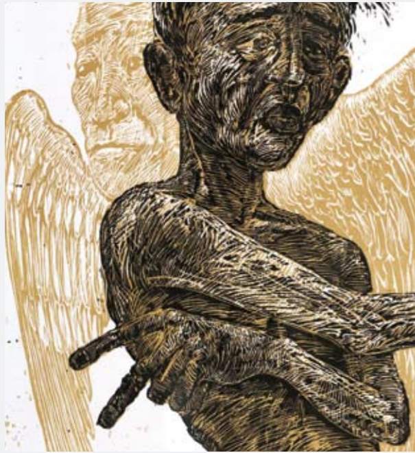
Rainer Ehrt, Europa Triptychon, Perseus (Ausschnitt) Holzschnitt

Zur IV. Ausstellung 2014 in der Galerie KUNST-KONTOR