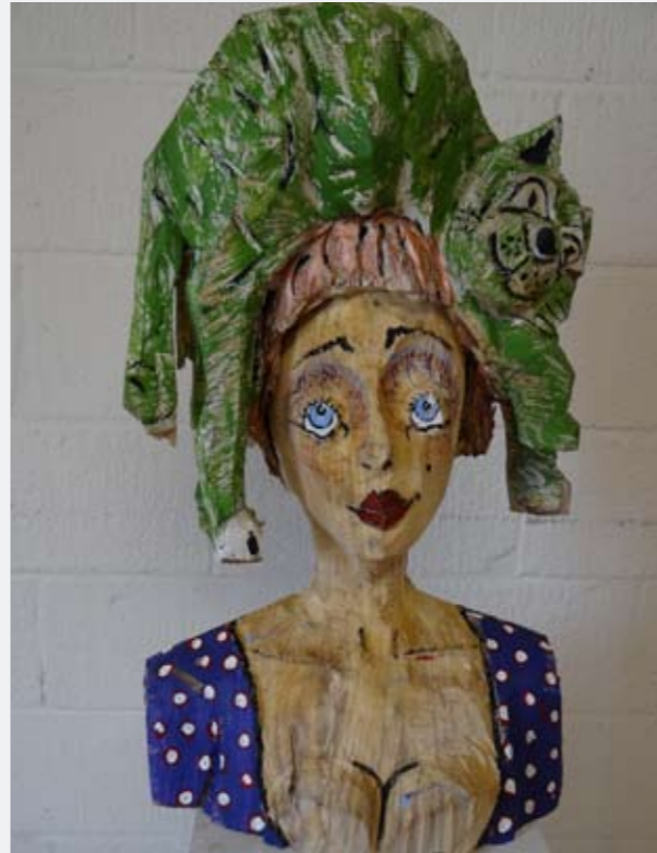
Titelseite rechts: Nau - Kleopatra, 1,65 m | Titelseite links: Ehrt - Traumtänzer IX, 1,80 m Außenseite Mitte rechts: Nau - Hauptkatze | Links: Nau - Frierendes Mädchen | Ganz rechts: Nau - Schwäne Innenseite Mitte: Ehrt - Triptychon Ariadne, Holzschnitt Höhe 1, 20 Meter

1971 geboren in Halle (Saale) | 1999 Dipl. Sportwissenschaften, Humboldt Universität zu Berlin | 2002 Universität Greifswald, Gastsemester bei Prof. Puritz | 2003 Universität für Angewandte Kunst Zwickau, Fachbereich Holzgestaltung | 2005 Minneapolis College of Art and Design, Gastsemester bei Prof. K. Akagawa | 2005-2006 Bauhausuniversität Weimar, Master „Art in public space and new strategies“