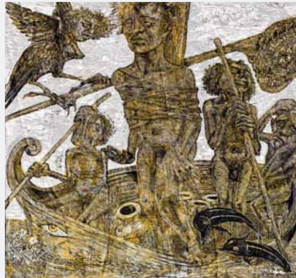
Odysseus Triptychon Mittelteil