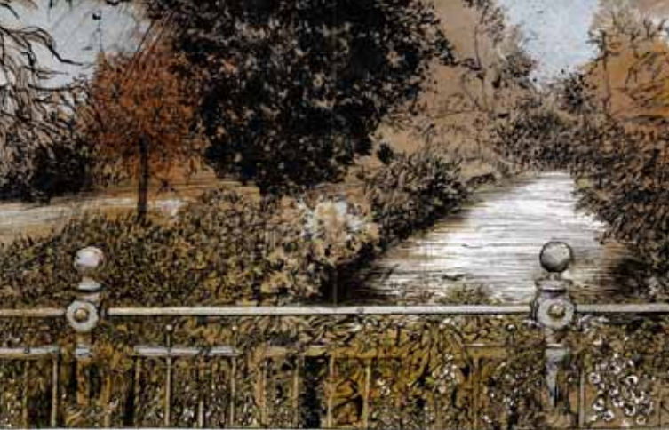
Der schöne Garten

Liebe Freundinnen und Freunde der Galerie KUNST-KONTOR,