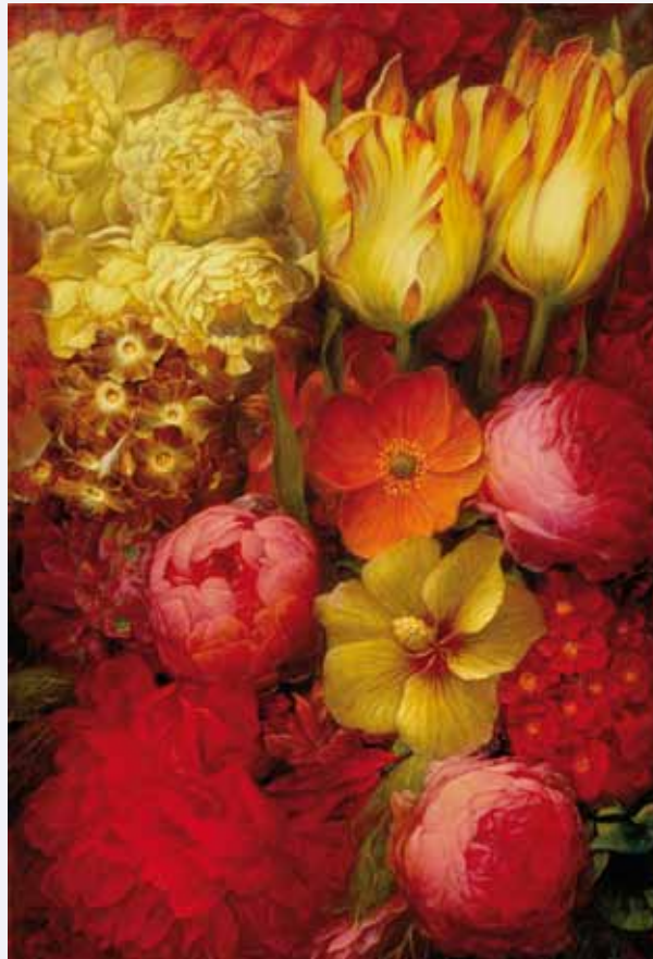
Anna Vonnemann: Stilleben, ohne Titel, 200 x 140 cm

Eine Künstlerin und ein Künstler, die uns die Möglichkeiten und die ganze PRACHT , zu der die Malerei fähig ist, vor Augen entfalten.