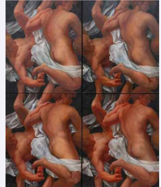
Anna Vonnemann: ohne Titel, 220 cm x 180 cm

Beide malen in altmeisterlicher Manier und sind dennoch künstlerisch im Hier und Heute. Doch die Handschriften könnten nicht unterschiedlicher sein.