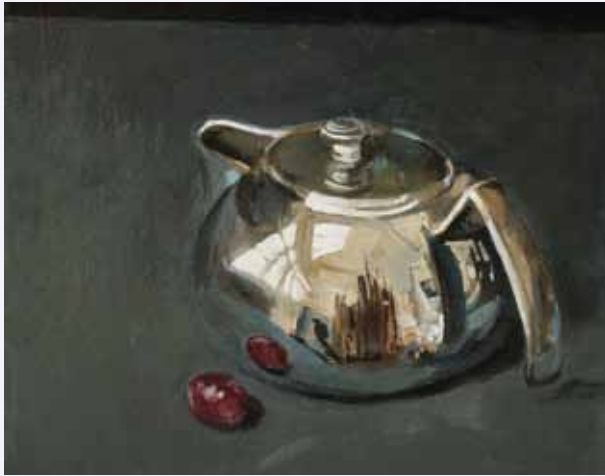
Pavel Feinstein, Stilleben mit Traube, 40 cm x 40 cm