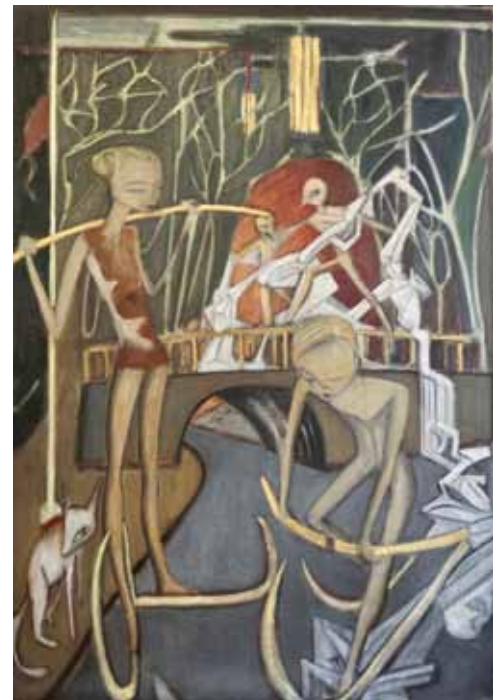
Mike Bruchner Ein Paradebeispiel 130 x 90 cm

Nicht zuletzt sind alle drei gesellschaftlich und poli- tisch wache Zeitgenossen. Seismografisch ertasten sie mit ihren Kunstwerken die gesellschaftlichen Verwer- fungen ohne in jeglichen „Politkitsch“ abzugleiten.