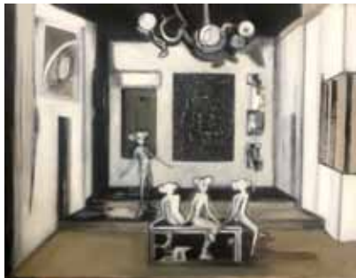
Mike Bruchner: Die Erzählung, 50 x 65 cm