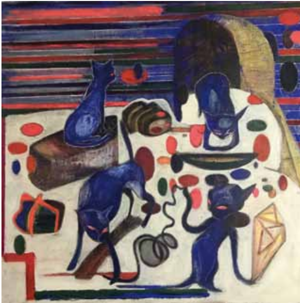
M. Bruchner: Rote Linien oder der Katzensprung, 110 x 110 cm