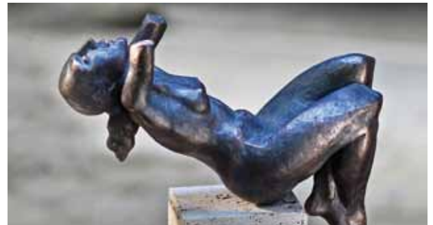
Roland Wetzel: Hingebung, 49 x 20 x 36 cm

Sein bildnerisches Werk durchzieht ein tektonischer Grundaufbau, aus dem sich dialektisch durchdringend, den Figuren Stabilität und Dynamik, Spannung und Lösung erwächst. Das Gleichnishaft, der tiefere Sinngehalt seiner menschlichen Figuren entspringt der Idee eines existentiellen Daseins der menschlichen Spezies.